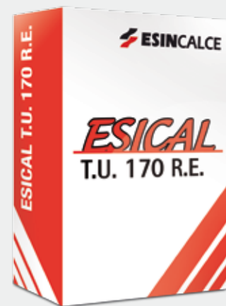
Sacco in carta

T.U. 170 R.E. è un premiscelato per la realizzazione di sottofondi ad asciugatura semirapida composto da inerti calcarei in curva granulometrica controllata, cemento e particolari additivi di nuova generazione che lo rendono particolarmente lavorabile.