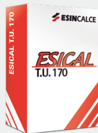
Sacco in carta

T.U. 170 è un premiscelato per la realizzazione di sottofondi a normale asciugatura composto da inerti calcarei in curva granulometrica controllata, cemento e particolari additivi di nuova generazione che lo rendono particolarmente lavorabile.